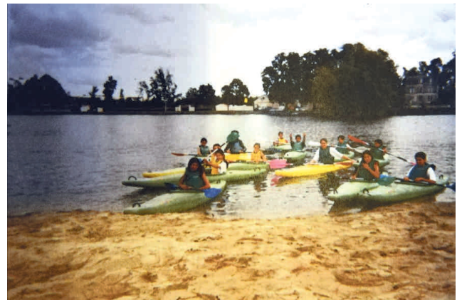
Canôe à St Jean d'Angély

1984 : 13 enfants au centre de Dieppe et 10 Dieppois à Beauvoir.